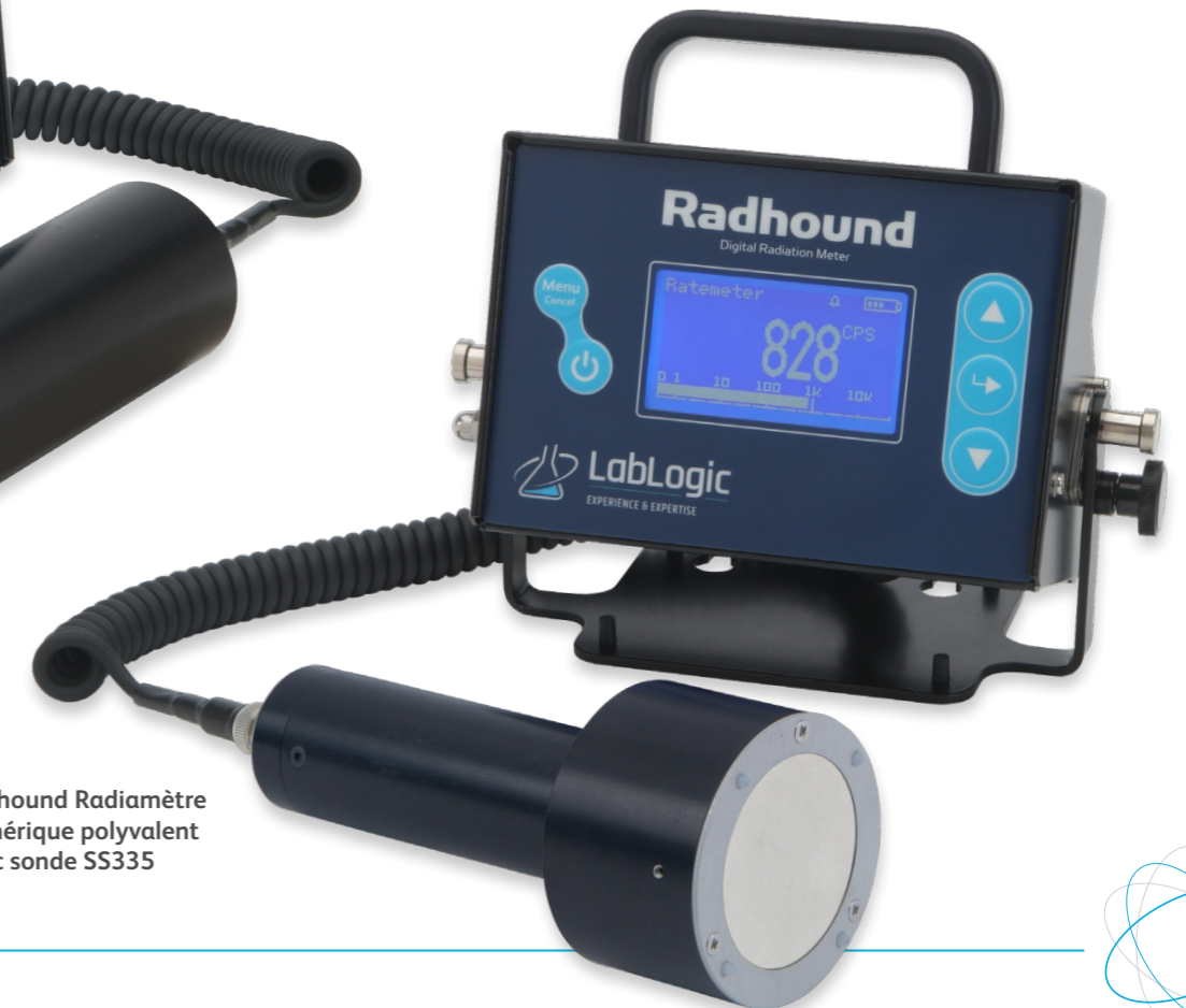
Radhound Radiamètre numérique polyvalent avec sonde SS335