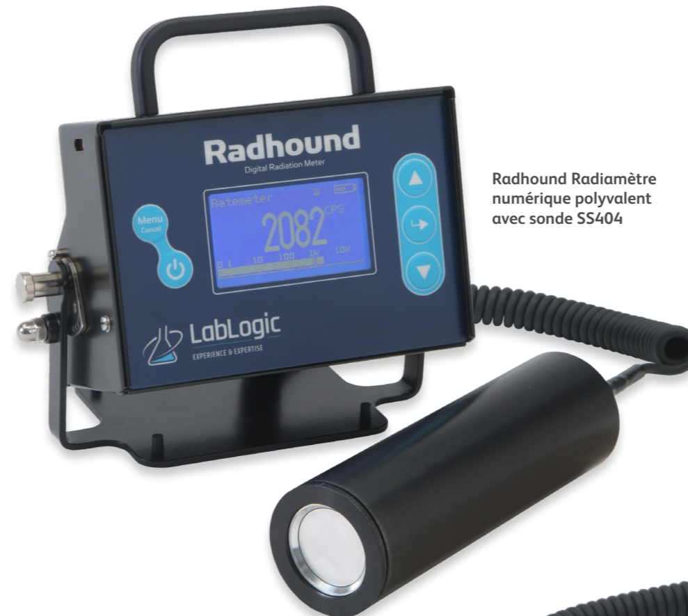
Radhound Radiamètre numérique polyvalent avec sonde SS404